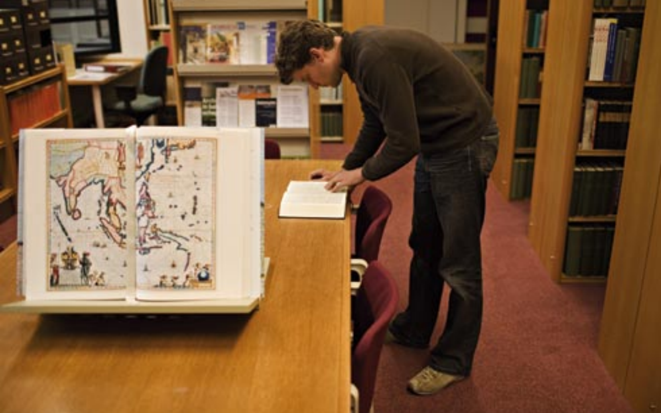
Foto links: De 'handbibliotheek' van het ING met de veelvuldig geraadpleegde Atlas Major van Blaeu.