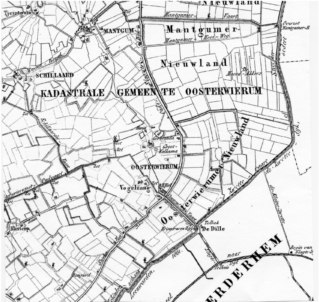
5 Uitsnede uit het blad Baarderadeel.